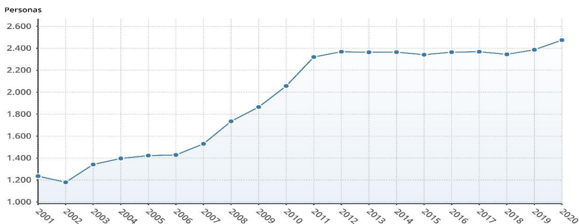
Así ha cambiado la población en Lominchar

En el año 2021, la población censada era de 2527 habitantes. En la actualidad, se aprecia un incremento de la población debido al efecto frontera con el Sur de la Comunidad autónoma de Madrid, que provoca un movimiento migratorio de familias que se instalan en los pueblos colindantes dentro de nuestra región, entre los que se encuentra Lominchar.